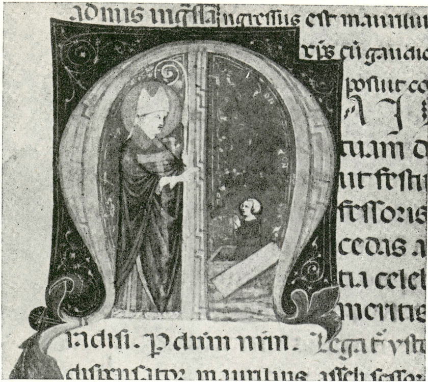
4. Św. Maureliusz wskrzeszający zmarłego. Mszał Mediolański . Rkps BAV Pal. Lat. 506 f. 187r.