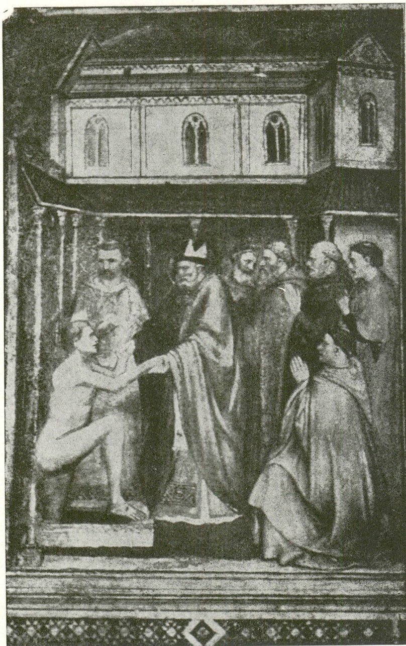
3. Asyż, kościół dolny, fresk z połowy XIV w. (schemat, nr 3) wg Kaftala.