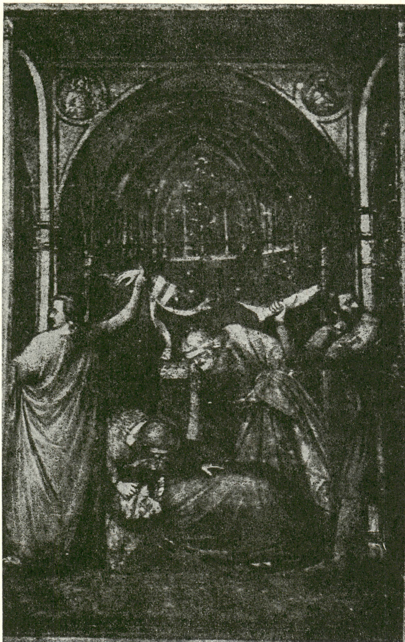
2. Asyż, kościół dolny, fresk z połowy XIV w. (schemat, nr 4) wg Kaftala.